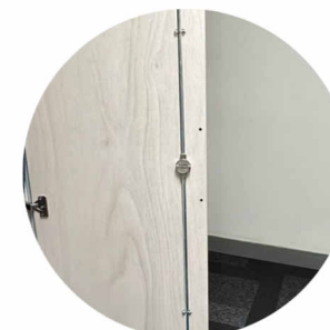
cerradura para muebles